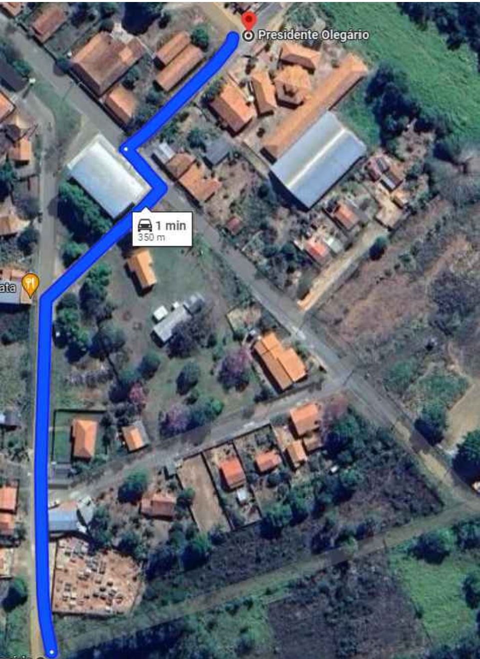
DMT Sem Escala